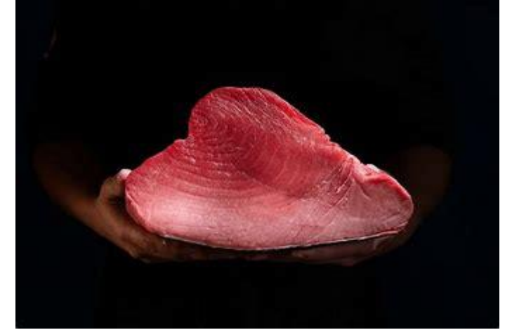
Processat i comercialització