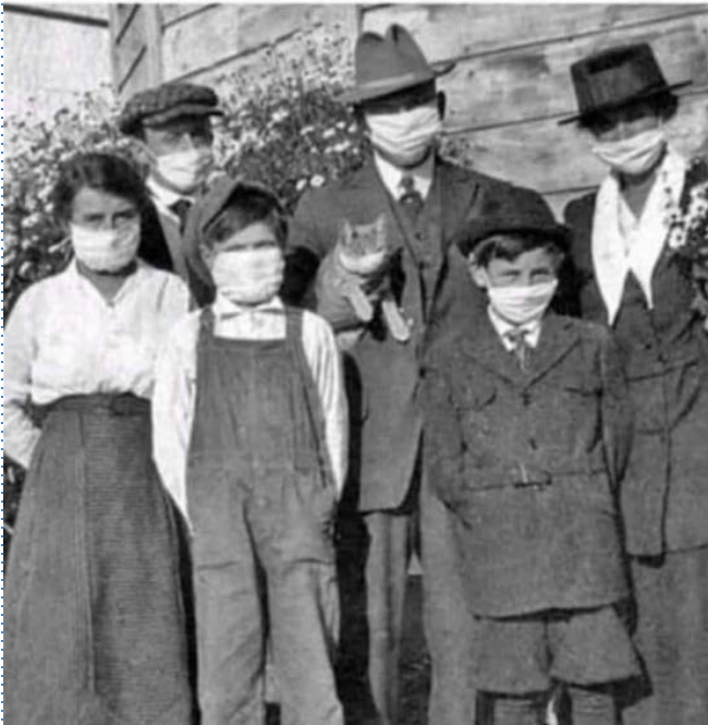
Foto di famiglia durante gli anni '20 e l'influenza spagnola. Notare il gatto, please....

Foto che ci fa molto riflettere. Anni '20 Anno 2020 Come non abbiamo imparato nulla dalla storia. Grazie a chi l'ha trovata