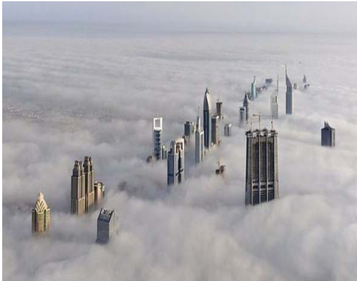
Dubai, la vista desde el rascacielos BurjKhalifa. La altura del edificio es de 828 metros, 163 pisos