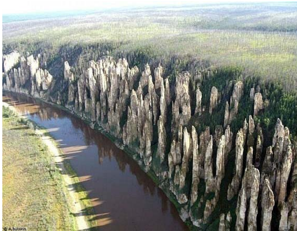
Pilares Lena, en el Río de su mismo nombre en Rusia