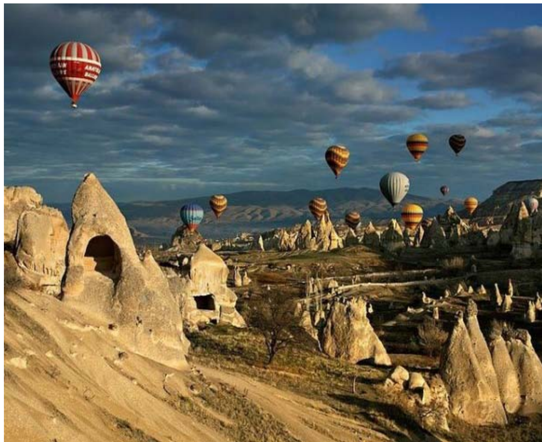
Globos de aire en Cappadocia