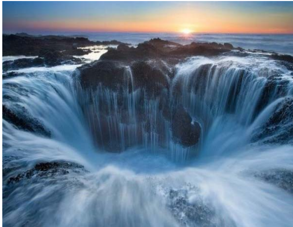
El pozo de Thor, conocido como los puentes de la cueva en Cabo Perpetua, Oregon. Durante la marea moderada y fuerte oleaje, las aguas fluyentes crean un paisaje maravilloso