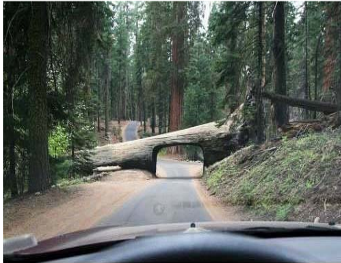
Insólito túnel natural en un parque de California.