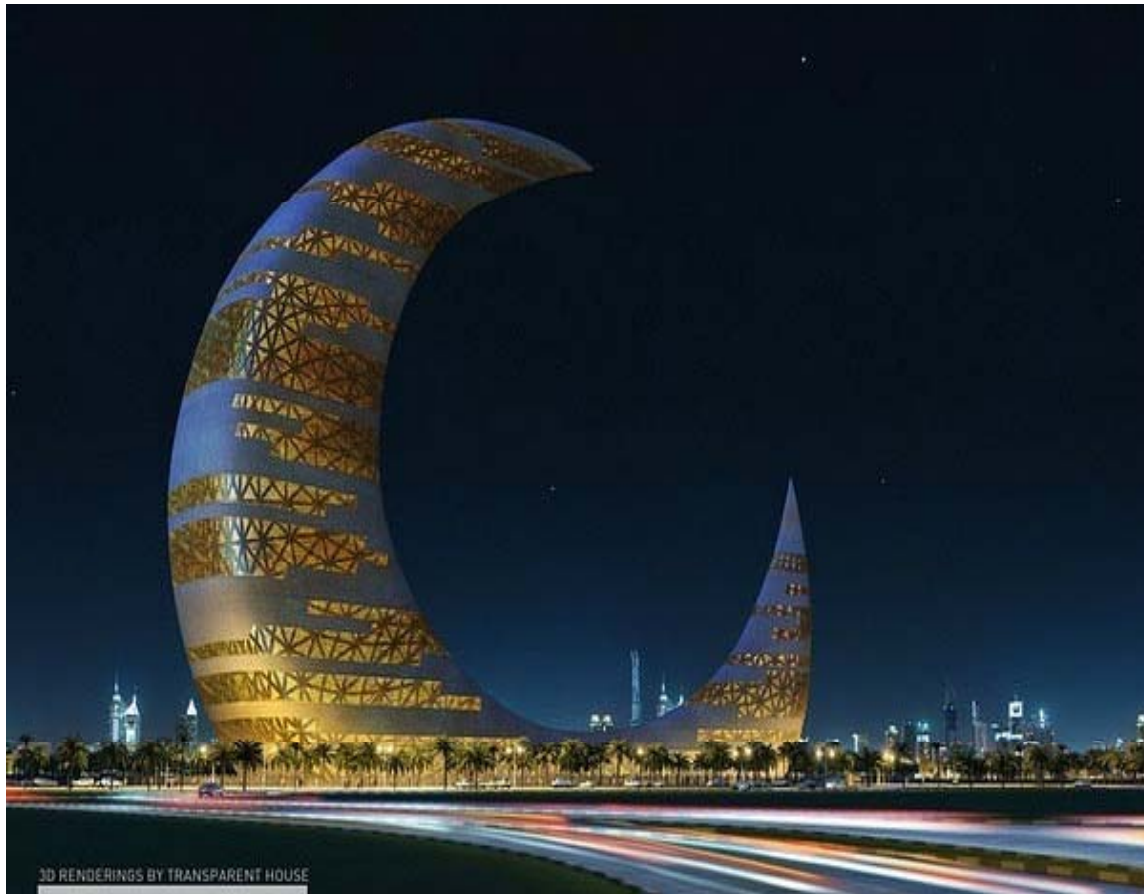
Rascacielos de cuarto creciente en Moon Tower, Dubai.