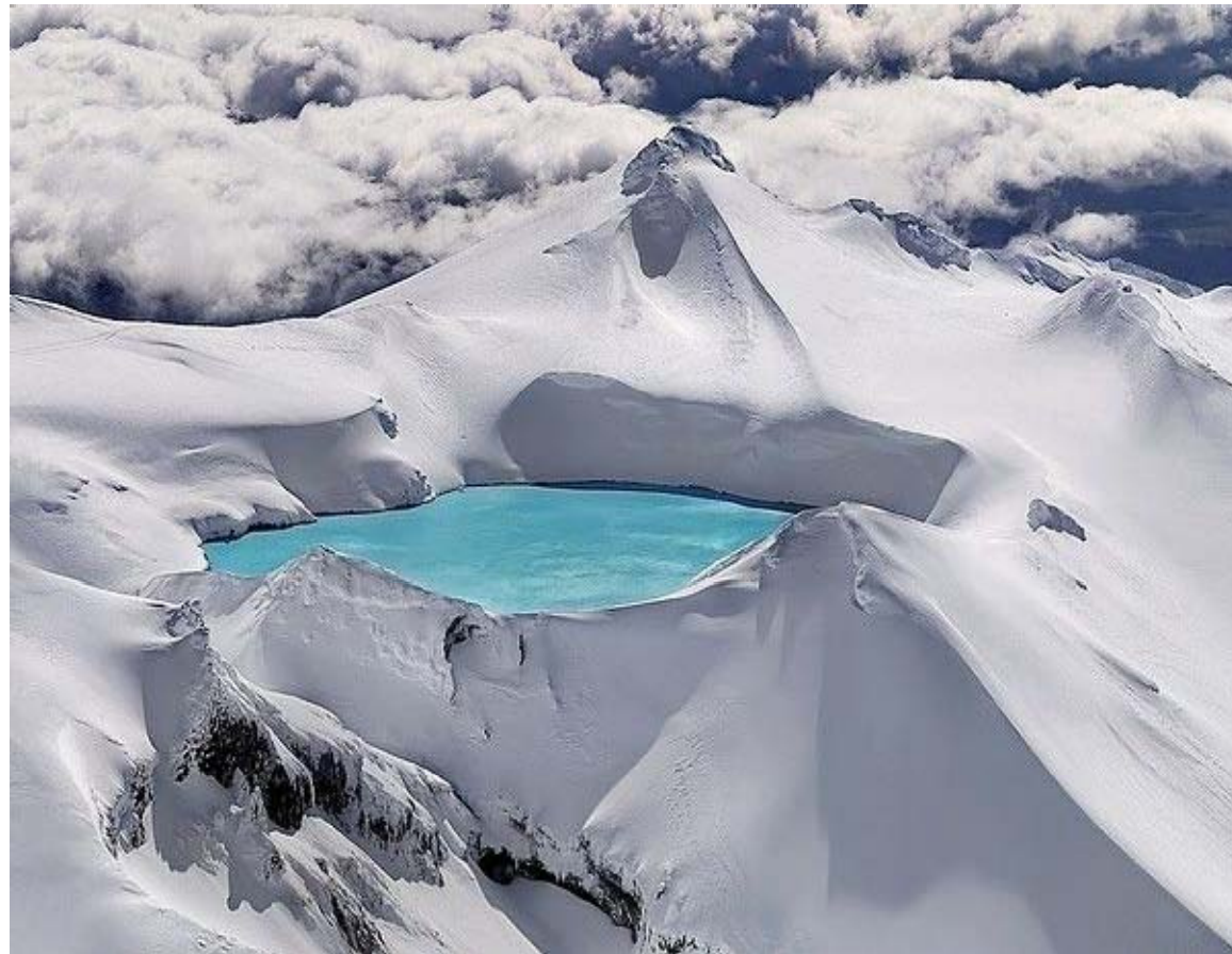
Cráter de volcán extinguido (Nueva Zelanda).