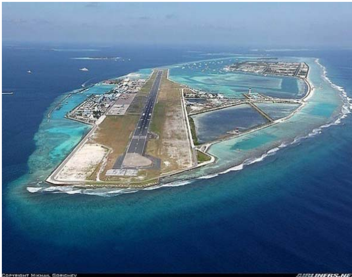
Aeropuerto en las Malvinas localizado en la isla artificial en medio del océano Índigo.