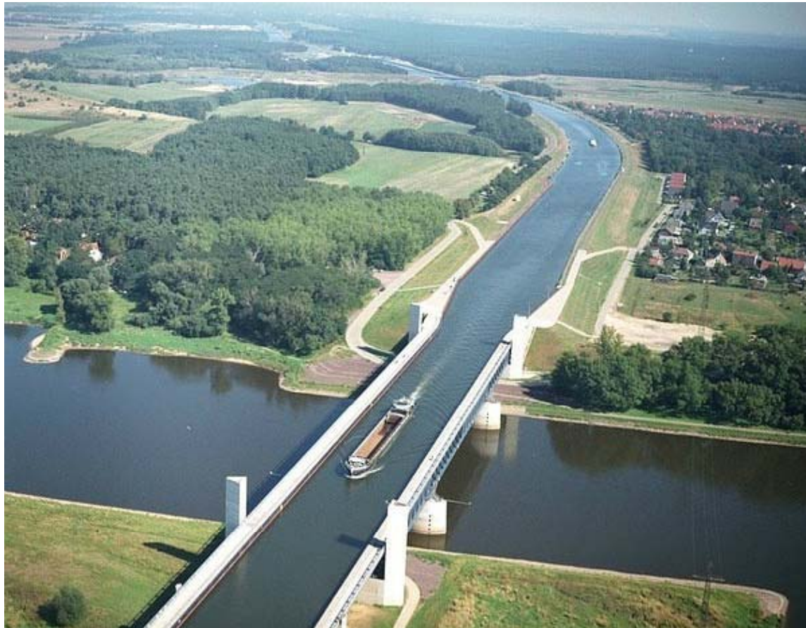
El río sobre el río: El puente de agua Magdeburg en Alemania.